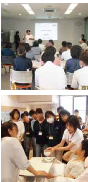
▲過去の研修会の様子

日本原病院内の取り組みだけではなく、地域へ向けた研修会を開催し、地域の皆様の「食」の支援に取り組んでいます。