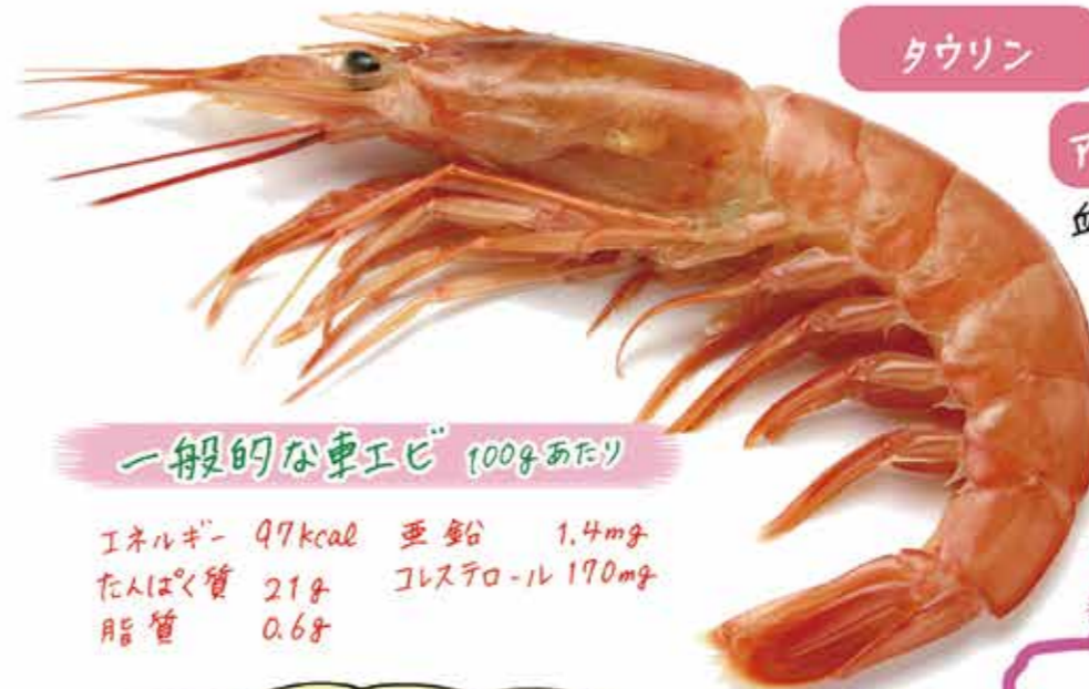
一般的な車エビ 100gあたり

エネルギー 97kcal 亜鉛 1.4mg たんぱく質 21g コレステロール 190mg 脂質 0.6g