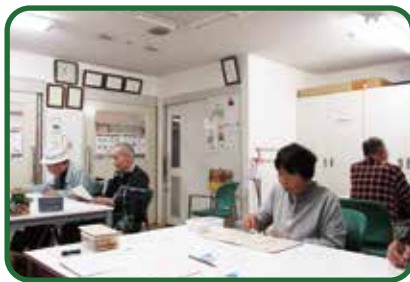
▶学習室の様子です。集中してできています。