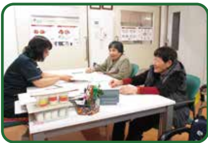
▶楽しくコミュニケーションが活性化します。