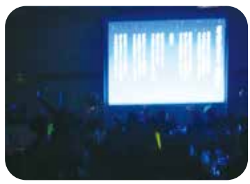
▲会場照明を落とし、ペンライトを振って「見上げてごらん夜の星を」を皆で歌いました。

3月10日(土)、津山鶴山ホテルで平成30年度の事業発展計画発表会が行なわれました。 今年度の事業発展計画が発表され、特別講演等も行なわれた後、懇親会が開かれました。 懇親会では食事をしながら、職員同士が交流しました。 おとなの学校は有志による出し物としてダンスと歌を披露しました。 参加者の皆さんも一緒に踊ったり歌ったりと、盛り上げて下さいました。